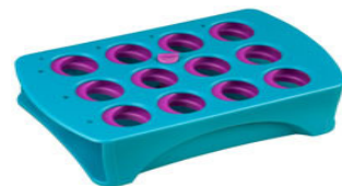
Heathrow No.HS24330A 16-30mm rack