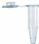
Neptune No.3745 1,6ml microtube